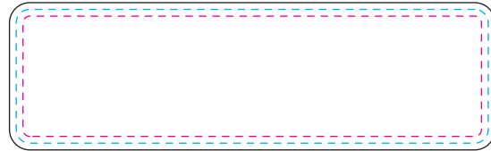
長方形 70×20mm (名札)