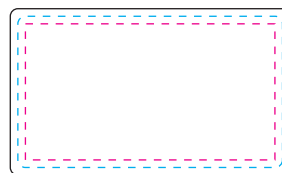
長方形 35 \times 20\text{mm} (ゴルフマーカー クリップ部)